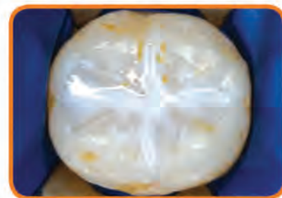
AFTER SEALANTS: Grooves & pits are sealed and protected from cavities

Provided in partnership with: Maricopa County Department of Public Health