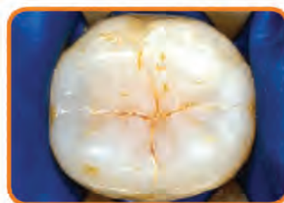
BEFORE SEALANTS: Food and bacteria become trapped in grooves & pits